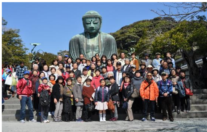
鎌倉の大仏の前で記念撮影

3月5日(日)、小学生から80歳代の総勢70名の参加で春の鎌倉を散策しました。大仏殿から長谷観音、小町通り、鶴岡八幡宮と若者の街に変わった鎌倉を満喫してきました。しかし、少し路地に入ると昔の鎌倉が残っており、魅力ある町並みでした。今回は地元宮城の参加者も多く大変有難うございました。